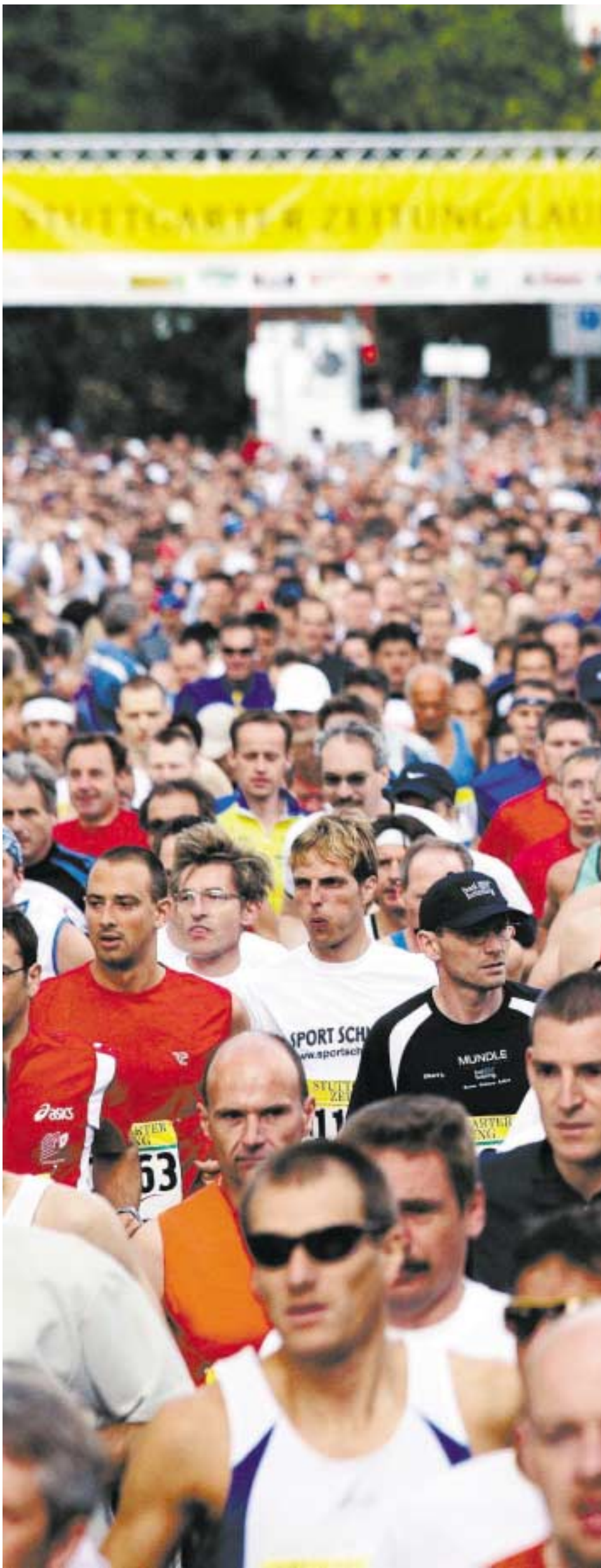
Vergangenes Jahr sind mit 21 980 Teilnehmern so viele Sportler wie nie zuvor gestartet.