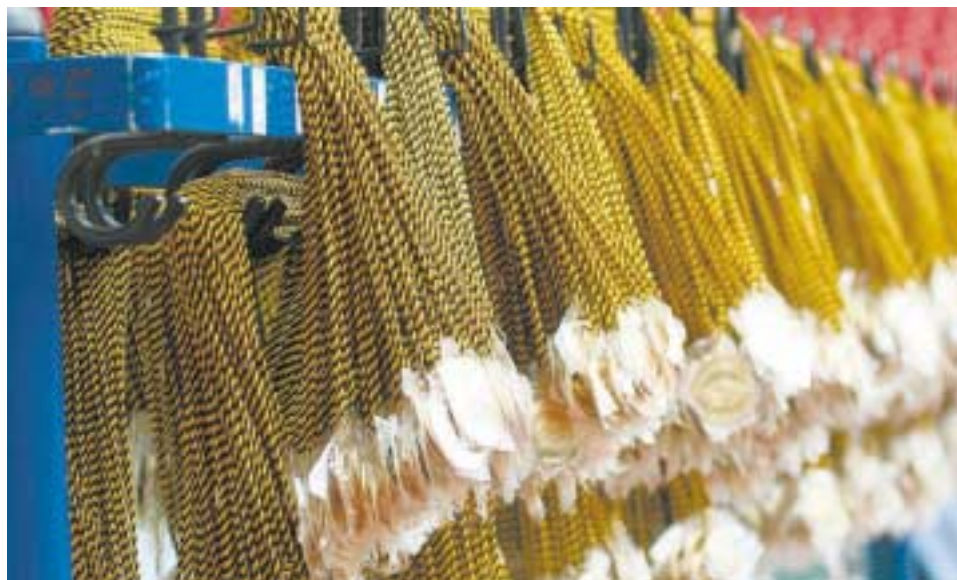
Erinnerungstück: jeder Teilnehmer, der das Ziel erreicht, bekommt eine Medaille.